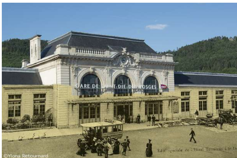
Extrait de la série du projet d'éducation artistique et culturelle 2019/2020

Le 01 janvier 2018, les établissements de l'OGEC du Val de Galilée et l'institution Sainte Marie ont fusionné pour ne créer qu'un seul ensemble scolaire : Marie de Galilée.